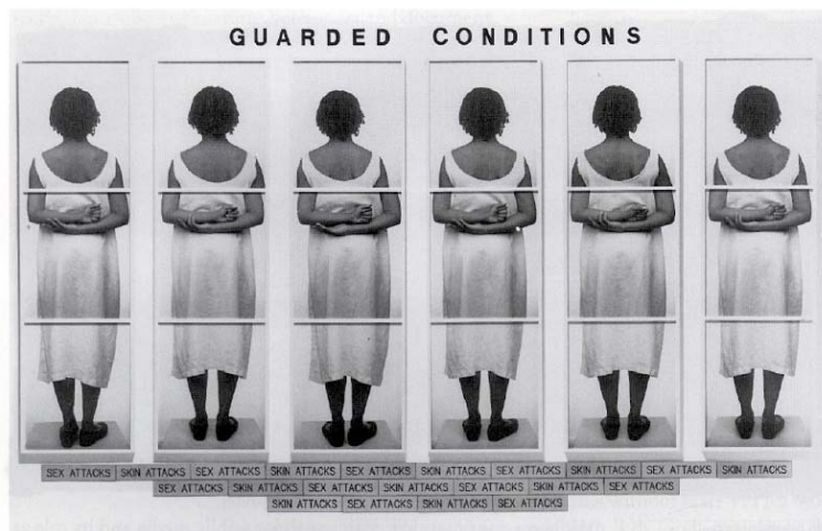
Lorna Simpson Guarded Conditions, 1990