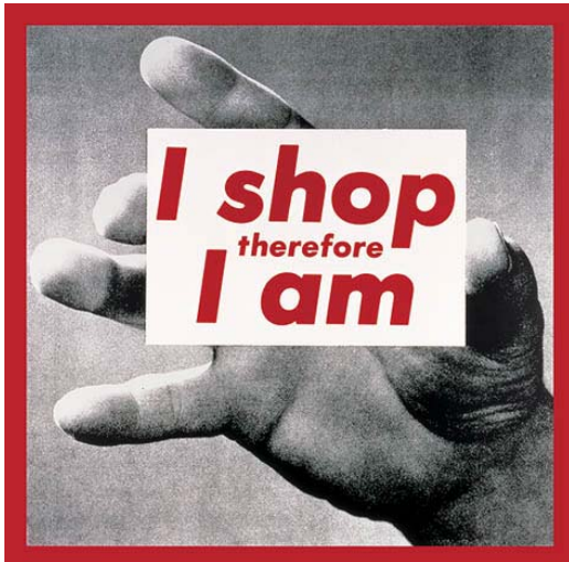
Barbara Kruger Untitled (I shop therefore I am), 1987

(Estas imágenes no hablan del rechazo, las proponemos como ejemplos de inclusión de texto e imagen, o de fotografías de personas afectadas y de trabajadores o activistas en su entorno)