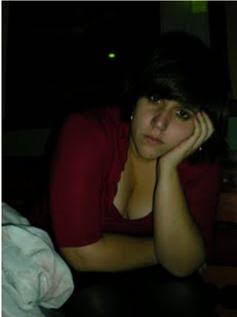
Nan Goldin. La balada de la dependencia sexual , 1995